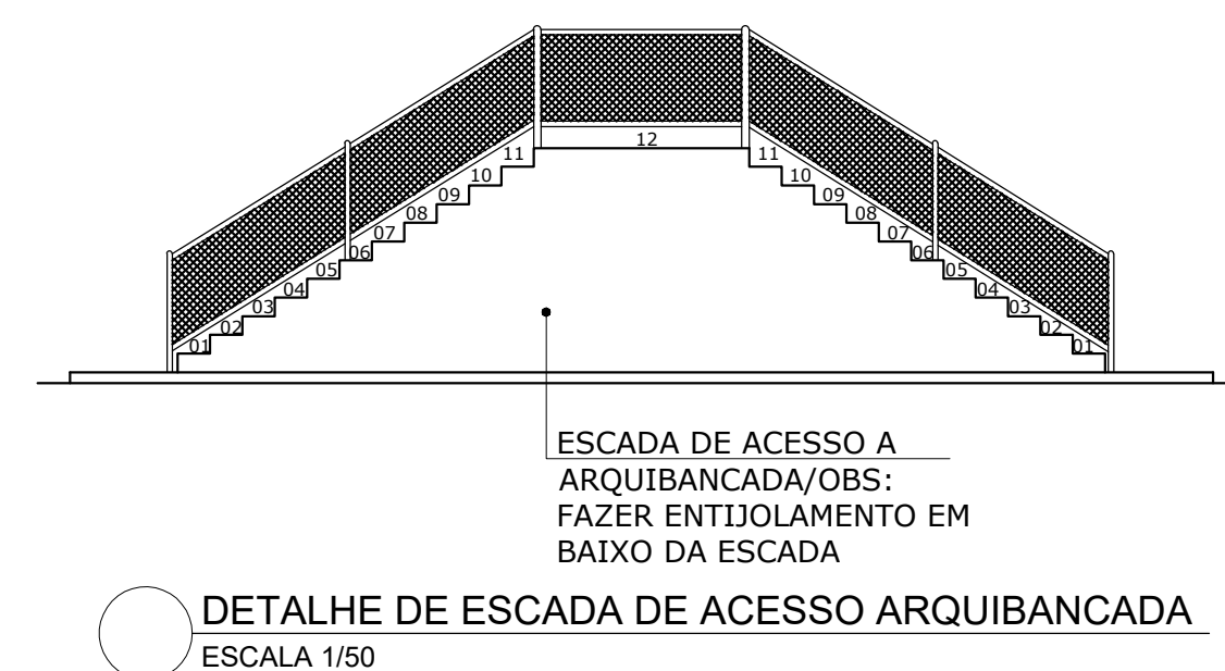
ESCALADA DE ACESSO A ARQUIBANCADA/OBS: FAZER ENTUOLAMENTO EM BAIXO DA ESCADA